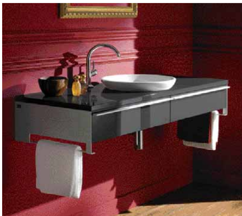
■ UMYVADLO NA DESKU ze série Loop&Friends k částečnému zapuštění, průměr 38 cm nebo 43 cm ve variantách s přepadem či bez přepadu. Cena od 8 027 Kč . SIKO KOUPELNY & KUCHYNĚ, www.siko.cz

■ UMYVADLO LA BELLE s podnoží v ladných křivkách je vyrobeno z materiálu R1 Alpin Ceramicplus. Nohy lze objednat ve dvou výškách a také ve dvou provedeních – pochromovaném nebo v barvě šampaňského. Cena od 23 360 Kč , cena podnože 15 969 Kč . SIKO KOUPELNY & KUCHYNĚ, www.siko.cz